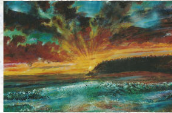
Or vert émeraude forêt