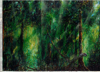
Or vert émeraude forêt

Vit le jour près d'Austerlitz, la contrée à blé, seigle, betteraves, vignes, perlée d'abricotiers, où chaque mètre carré est planté donc aucune minute de trop. D'une lignée de petits paysans jadis serves ou libres, qui sortirent de la Terre, la cultivèrent et sont résorbés par Elle, anonymes. Ils devaient nourrir les citadins, payer les impôts, fournir la chair à canon.