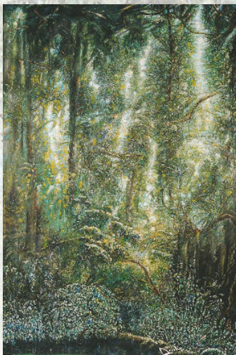
Plénitude en Vert

A bord de son Cessna 185, «l'épicier volant» rallie une ou deux fois par semaine le bourg de Saint-Elie, village d'orpailleurs perdu au cœur sur de la forêt guyanaise, inaccessible par la route.